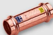
Art. FP.9271 hrdlo prodloužené F x F