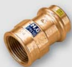
Art. FP.8270 přechodové hrdlo F x Fil. F