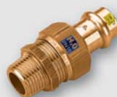
Art. FP.8341 šroubení s vnějším závitem F x Fil. M