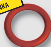
Art. FP.KRxxRED speciální O-kroužek FKM (oleje, topné oleje, PHM, organická rozpouštědla)*